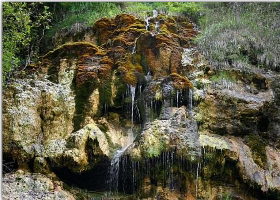
Obrázok 10 Tajovská kopa

V časti Kopanice sa nachádza chránený prírodný útvar „Tajovská kopa“, na ktorej je postavený obecný vodojem (1929).