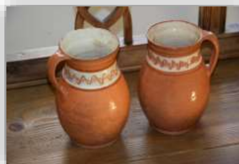
Obrázok 2 Hrnčiarske výrobky z Tajova

Vyrábali sa tu aj svojrázny hrnčiarsky riad.