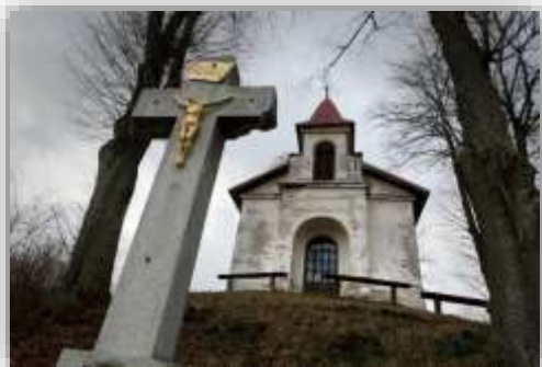
Obrázok 5 Kalvária v Tajove