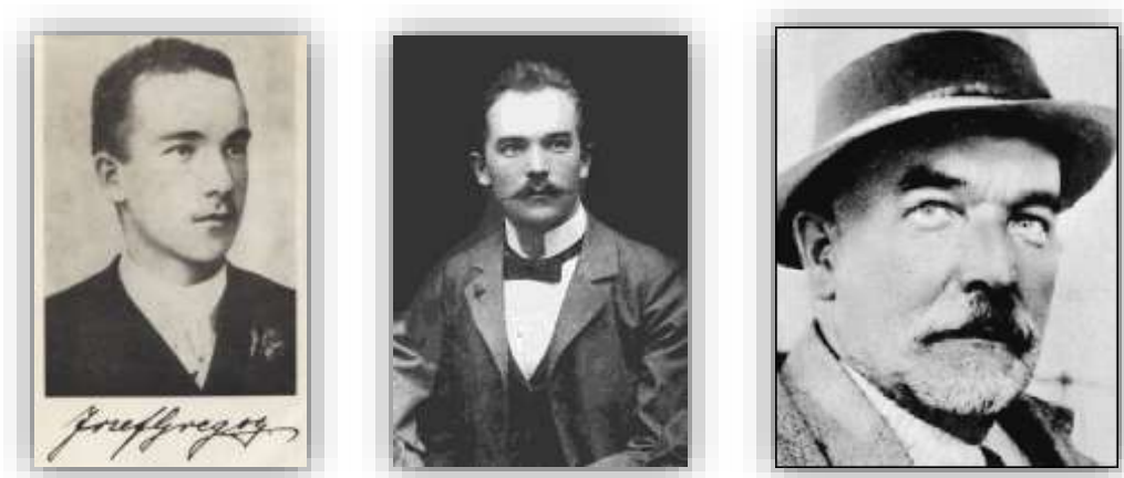
Obrázok 11 /1/2/3 Jozef Gregor Tajovský

Jozef Gregor Tajovský (18. 10. 1874 – 20. 05. 1940) žije v povedomí slovenského národa, ako obľúbený spisovateľ poviedok a divadelných hier. Jeho vyjadrovanie o dobe, v ktorej žil, je zaujímavé dejom, ale aj krásou ľudovej reči. Divadelné hry ako Ženský zákon, Statky – zmätky a i.