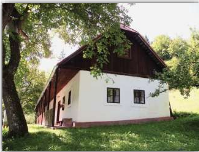
Obrázok 7 Dom Jozefa Murgaša v Tajove