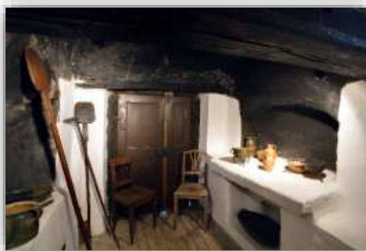
Obrázok 9 Expozitúra v rodnom dome J. G. Tajovského

V zozname kultúrnych pamiatok je evidovaný kostol sv. Jána Krstiteľa (1592), rodný dom Jozefa Gregora Tajovského (1799) a rodný dom Jozefa Murgaša.