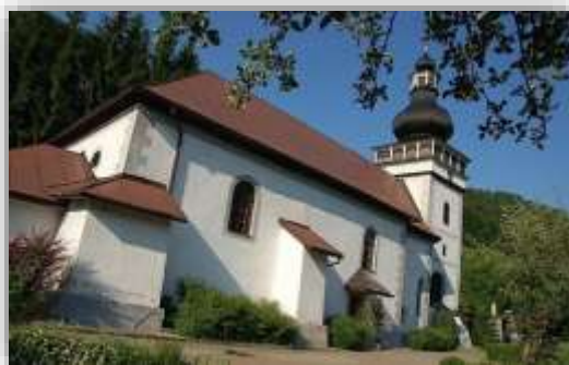
Obrázok 6 Rímskokatolícky kostol sv. Jána Krstiteľa