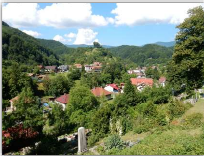
Obrázok 1 Obec Tajov 1

Obec Tajov vznikla asi v 15. storočí, na území rodiny Radvanských a rozšírila sa v roku 1496 – 1500, kedy Ján Thurzo vybudoval dve huty – hornú a dolnú, na čistenie medi. Huty sa stali súčasťou banskobystrického mediarskeho podniku. V 16. storočí zamestnávali 70 – 100 robotníkov (vrátane uhliarov a povozníkov). Aj keď sa výroba v hutách od druhej polovice 16. storočia obmedzovala, prevádzka sa v nich udržala do roku 1893. Po likvidácii hút Tajov nemohol poskytnúť náhradné pracoviská všetkým robotníkom. Väčšina sa zamestnala v priemyselných podnikoch na okolí – v papierni v Harmanci, v Medenom Hámri v Banskej Bystrici, v Banskej Štiavnici.