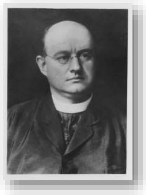
Obrázok 12 Jozef Murgaš

Jozef Murgaš (17. 02. 1864 – 11. 05. 1929), ako katolícky kňaz, mal aj viacero civilných záujmov. Okrem maliarstva ho priťahovala bezdrôtová telegrafia, v ktorej dosiahol úspechy v USA, kde sa v roku 1896 usadil medzi Slovákmí. Objavom tónovej modulácie, patentovanej v roku 1904, ako Tón systém, vzbudil pozornosť vynálezcov v tomto odvetví. Mal 12 patentov z rádiotelegrafie, patent na rybársky naviják, bol spoluautorom ďalších dvoch vynálezov (oblúkové lampy).