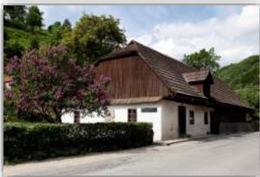
Obrázok 8 Rodný dom Jozefa Gregora Tajovského