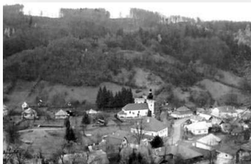
Obrázok 4 Obec Tajov 2

Školu v Tajove založili jezuiti v roku 1657 a trvala nepretržite do konca školského roku 1978/79. Po zrušení druhej triedy základnej školy, v roku 1951, sa uvoľnili dve miestnosti v budove obvodného notariátu, čím sa naskytla príležitosť na založenie materskej školy pre deti od troch, do šiestich rokov, s dopoludňajšou prevádzkou. Prestavbou prízemnia tejto budovy, sa v roku 1963 vytvorili podmienky na materskú školu s celodennou prevádzkou, ktorá trvá dodnes.