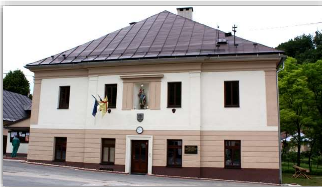
Obrázok 3 Obecný úrad v Tajove