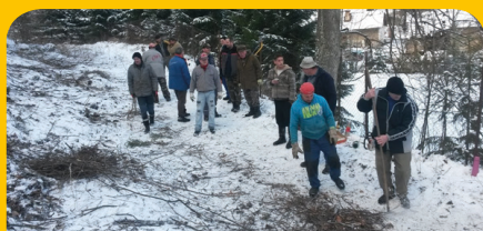
Takto sme začínali budovať chodník na Kalváriu