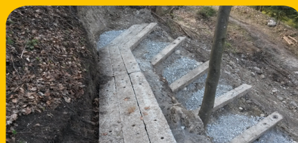
Takúto podobu má dnes