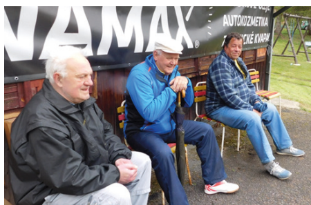
Skalní .... Na každom zápase na svojich miestach.