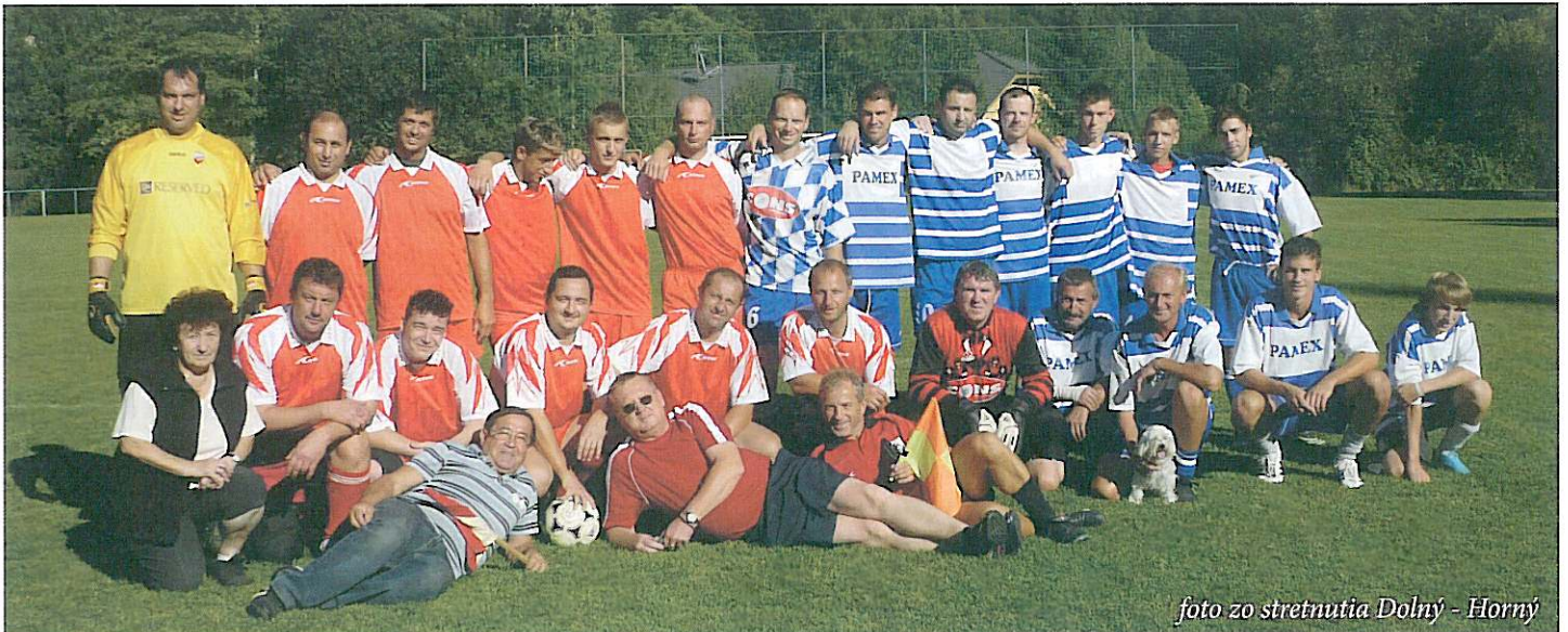
foto zo stretnutia Dolný - Horný