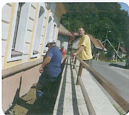
Zabráníť vlhnutiu múrov na fare má aj položenie izolačných ochranných fólií.