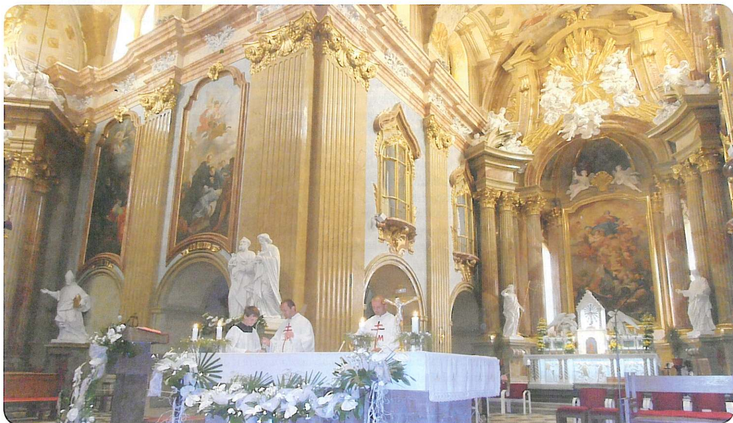
omša na velehrade