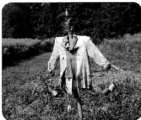
Ani strašiak nezhabráni vysievaniu burín zo susedného pozemku do zemiačiska...

Zákon číslo 220/2004 v § 3: „Starostlivosť o poľnohospodársku pôdu“ prikazuje predchádzať výskytu a šíreniu burín na neobrábaných pozemkoch. V našej obci sa nachádza mnoho pôdy, ktorej vlastníci zanedbávajú jej obrábanie alebo aspoň nepredchádzajú výskytu a šíreniu burín. Napríklad - na Hrádku a na Beňovej už prevažujú zaburinené pozemky nad tými, na ktorých sa pestujú plodiny. Buriny so sebou prinášajú škody na kvalite pôdy a na zberaných plodinách. Zanedbávaním starostlivosti o poľnohospodársku pôdu dochádza k jej poškodeniu a znižuje sa jej kvalita. Dochádza k zníženiu úrody na neošetrených a susediacich pozemkoch, pri zbere úrody sa zamiešajú cudzorodé semená do semien zberaných kultúrnych plodín, čo môže znížiť kvalitu zberaných plodín. Ohrozujú ekologickú stabilitu územia a narúšajú estetický vzhľad krajiny. Odporúča sa aspoň dvakrát za sezónu burinu pokosiť, aby sa predišlo jej dozretiu a vysievaniu.